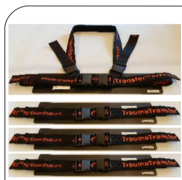
TTX Next Gen™ Krysskoppling 1+ 3 st SMART™ bälte