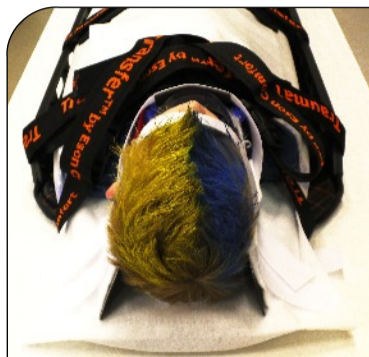
TT-Cover K-Light 2020™ Mini - Engångsöverdrag med separata huvudkuddar till TraumaTransfer™. Värmer patienten och skyddar madrassen. Reducerar tiden för rengöring.

OBS! Vi avråder starkt från användning av andra icke godkända lösningar, då det finns bevisat osäkra och miljökadliga lösningar på flera svenska sjukhus, vars utseende är ganska snarlika våra original.