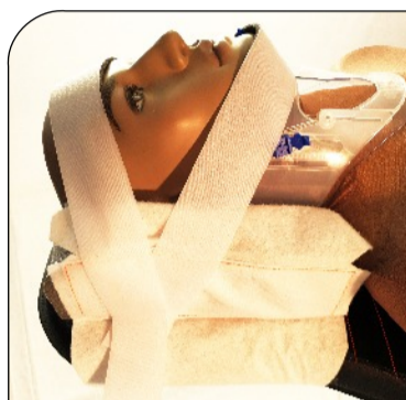
TT-Headfix 2014™ Mini - Patenterad immobiliseringslösning för TraumaTransfer™ Mini. Kompletterar TT-Cover 2014™ Mini, när inte heltäckande lösning efterfrågas.